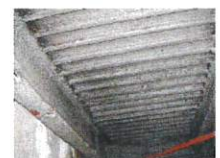
アスベスト含有吹付け ロックウール （鉄骨材の耐火被覆）