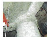
吹付けアスベスト （鉄骨材の耐火被覆）

建築基準法において規制対象とする吹付石綿等が施工されているおそれのある建築物に対しては、地方公共団体が調査および除去等の費用の一部を補助している場合があるので、お近くの地方公共団体にご相談ください。